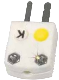
4.93 mm (0.19") 와이어 액세스 홀

SHX 초소형 커넥터는 고온에서 미세직경 써모커플 사용할 때 안정맞춤입니다. SHX 커넥터는 ANSI 규격과 오메가 자체기준에 따라 공정 중 제품 오염 가능성이 있는 고 진공로 작업 같은 경우에서도 영구 사용 가능하도록, 컬러도트로 표기 구분됩니다. USHX 커넥터의 경우 제거할 수 있는 컬러 도트로 표기가 되어 있습니다.