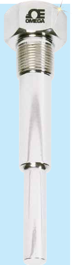
그림은 실제 크기와 비슷합니다.

† NPSM 내부 파이프 나사는 NPT와 NPS 수형 나사를 모두 허용합니다.