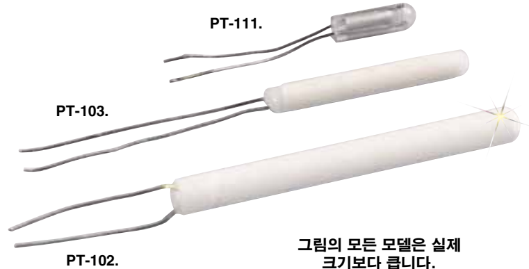
그림의 모든 모델은 실제 크기보다 큼니다.