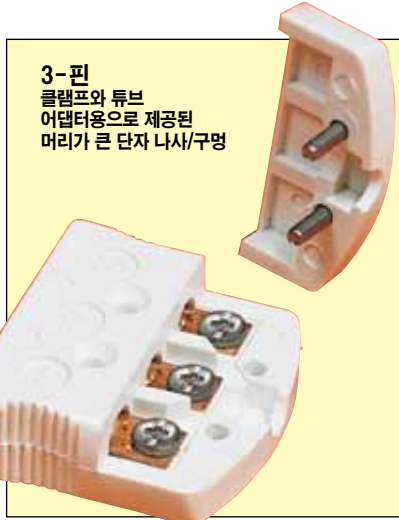
3-핀 클램프와 튜브 어댑터용으로 제공된 머리가 큰 단자 나사/구멍