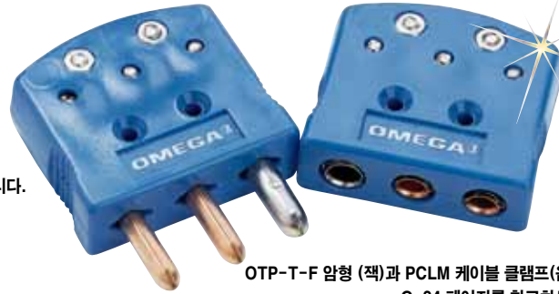
OTP-T-F 암형 (잭)과 PCLM 케이블 클램프(음선) G-24 페이지를 참고하세요.