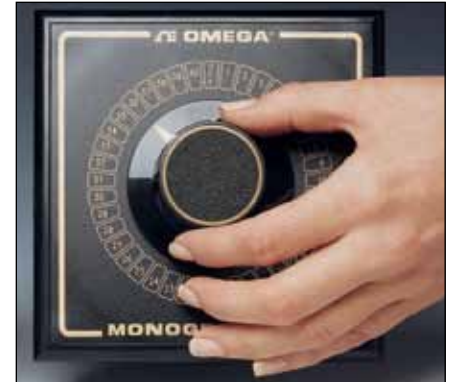
금박 접촉면이 있는 MONOGRAM® 시리즈

OMEGA는 등온 및 낮은 저항으로 온도 측정 회로를 전환하기 위한 3가지 방식의 선택 스위치를 제공합니다. OSW 방식은 은도금 접촉면이 특징이고, 반면 OSWG 제품군은 금도금 접촉면을 포함합니다. SW14 1/4 DIN