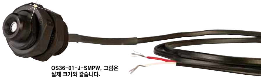
OS36-01-J-SMPW, 그림은 실제 크기와 같습니다.