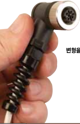
변형을 완화한 M12 직각 소켓 커넥터.