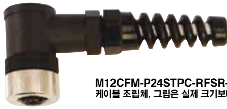
M12CFM-P24STPC-RFSR-MINIDIN-3, 케이블 조립체, 그림은 실제 크기보다 작습니다.