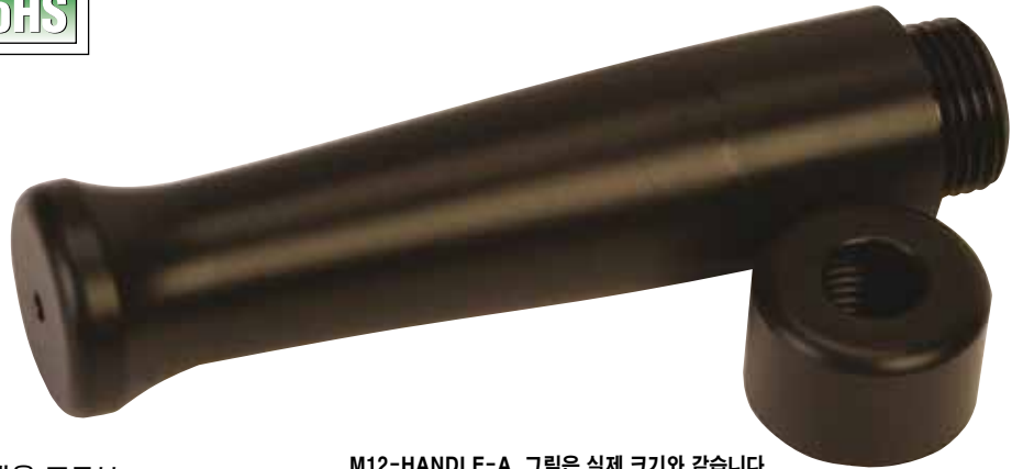
M12-HANDLE-A, 그림은 실제 크기와 같습니다.

오메가의 튼튼한 M12 프로브 손잡이는 휴대용 프로브 장치를 폭 넓게 이용하기 위해 빠르고 쉽게 연결하도록 합니다. 그리고 현장에서 도구 없이 감지 소자를 빠르게 교체할 수 있습니다. M12 프로브는 손잡이로 들어가고 커넥터 끝부분이 노출되도록 합니다. 손잡이는 TH-21A 시리즈 써미스터, PR-21A, PR-25AP 시리즈 RTD, M12 시리즈 써모커플과 호환됩니다. 예: M12KIN-1/4-U-12-A, 액세서리 도표를 참고하세요.