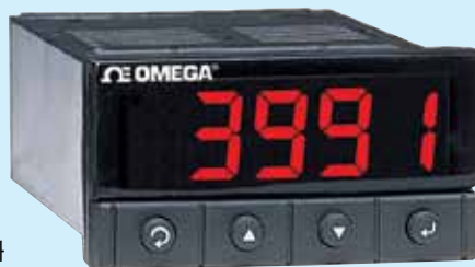
DPi32 1/32 DIN 온도/공정 계측기, 그림은 실제 크기와 같습니다.

i시리즈 계측기와 제어장치는 완전히 프로그래밍 가능한 컬러 디스플레이가 있고 인터넷 연결 장치가 내장되어 있습니다. 계측기는 "M", 제어장치는 "P" 장을 참고하세요.