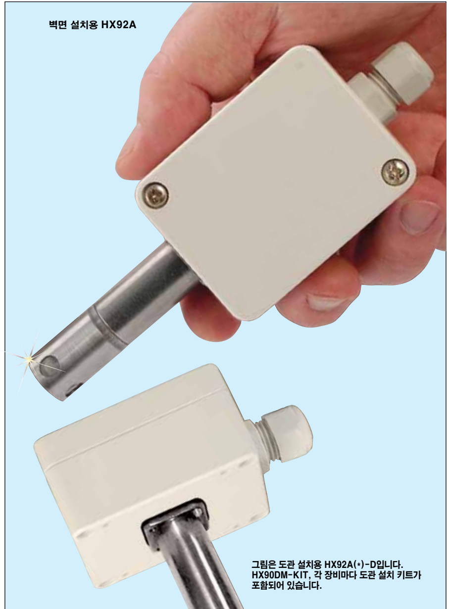
벽면 설치용 HX92A

† NIST 캘리브레이션 주문 정보를 알아보려면 다음 페이지에 있는 주문 도표를 참고하세요.