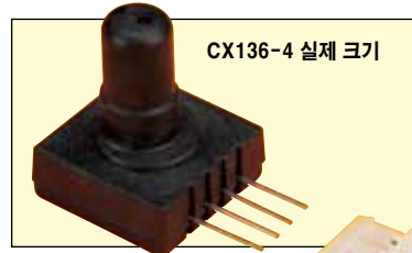
CX136-4 실제 크기