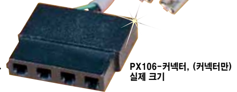
PX106-커넥터, (커넥터만) 실제 크기

주문하려면 kr.omega.com/cx136 에 방문해 가격과 자세한 사항을 확인하세요.