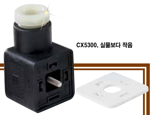
CX5300, 실물보다 작음