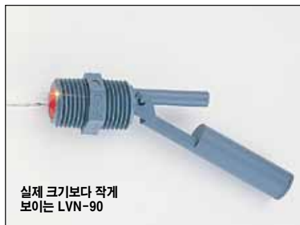
실제 크기보다 작게 보이는 LVN-90