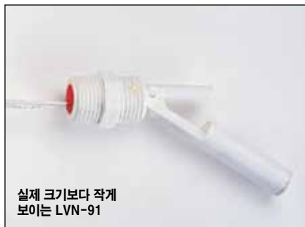
실제 크기보다 작게 보이는 LVN-91