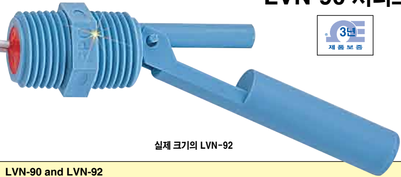
실제 크기의 LVN-92

액체 레벨 스위치는 도기류 화합물로 봉인되어 있습니다. 용액이 전기 스위치로 가는 유일한 경로는 와이어를 통해 지나게 됩니다. 와이어가 적절한 방법으로 연결되면(예를 들어, NEMA 6 (IP68) 커넥터), 레벨 스위치는 습기찬 환경에서 오랫동안 걱정 없이 작동되는 침수에 적합한 NEMA 6 (IP68) 정격이나 그 이상의 내구성을 갖게 됩니다. 봉인된 SPST 스위치는 충격 효과와 최소한의 진공 또는 진동의 일관된 정밀도와 높은 반복성을 제공합니다.