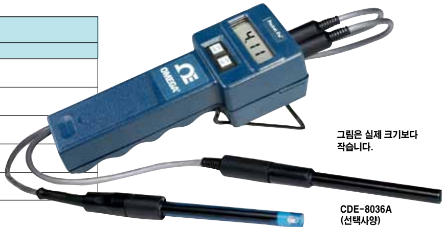
그림은 실제 크기보다 작습니다.